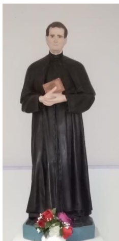
Statua di S. Giovanni Bosco nell'oratorio di Fossà