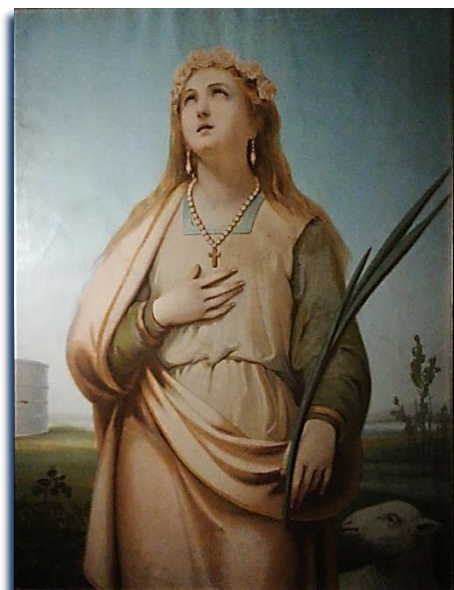
Sant'Agnese in un quadro del primo '900 proveniente dalla vecchia chiesa di Grassaga, ora nella sacrestia della parrocchiale

Curiosità: Il nome spagnolo Ines , diffuso anche da noi, equivale al nostro Agnese.